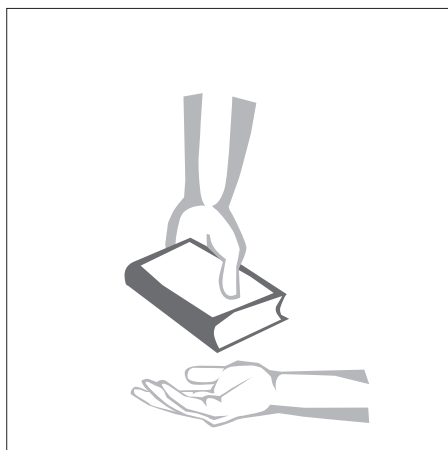
Ons ontvang wat God gee